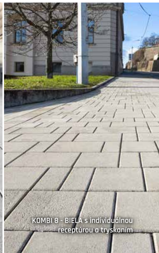
KOMBI 8 - BIELA s individuálnou receptúrou a tryskaním