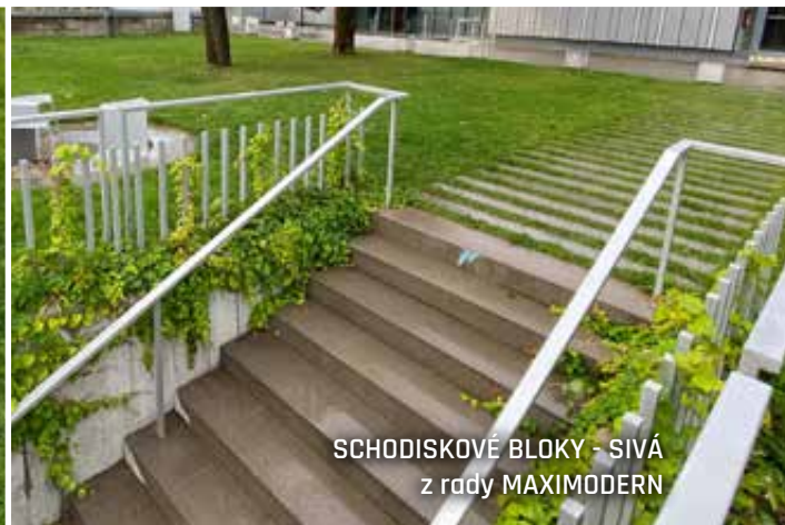
SCHODISKOVÉ BLOKY - SIVÁ z rady MAXIMODERN