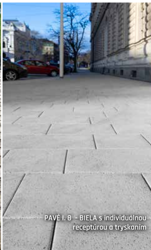
PAVÉ I. 8 - BIELA s individuálnou receptúrou a tryskaním