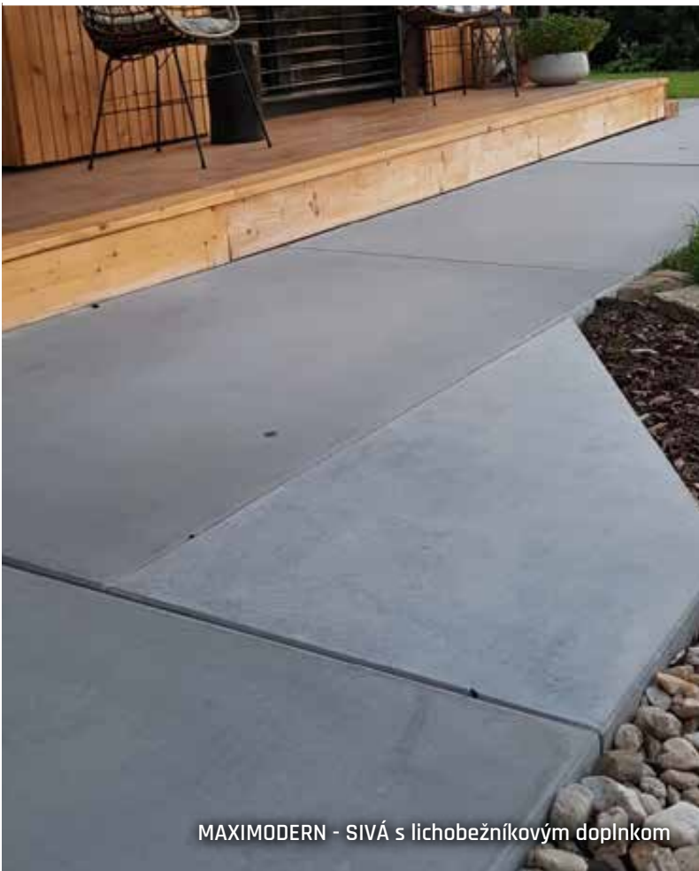
MAXIMODERN - SIVÁ s lichobežníkovým doplnkom

Veľmi obľúbené sú aj prvky doplnené o odtlačky, tryskané pružky či s kompletným otryskaním. Jednoduchšiu manipuláciu potom umožní prídanie manipulačných prvkov.