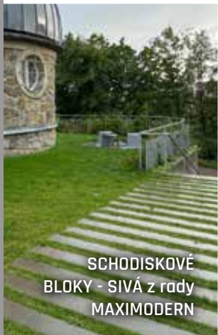
SCHODISKOVÉ BLOKY - SIVÁ z rady MAXIMODERN

Na atypické výrobky sa tiež vzťahuje záruka 20 rokov.