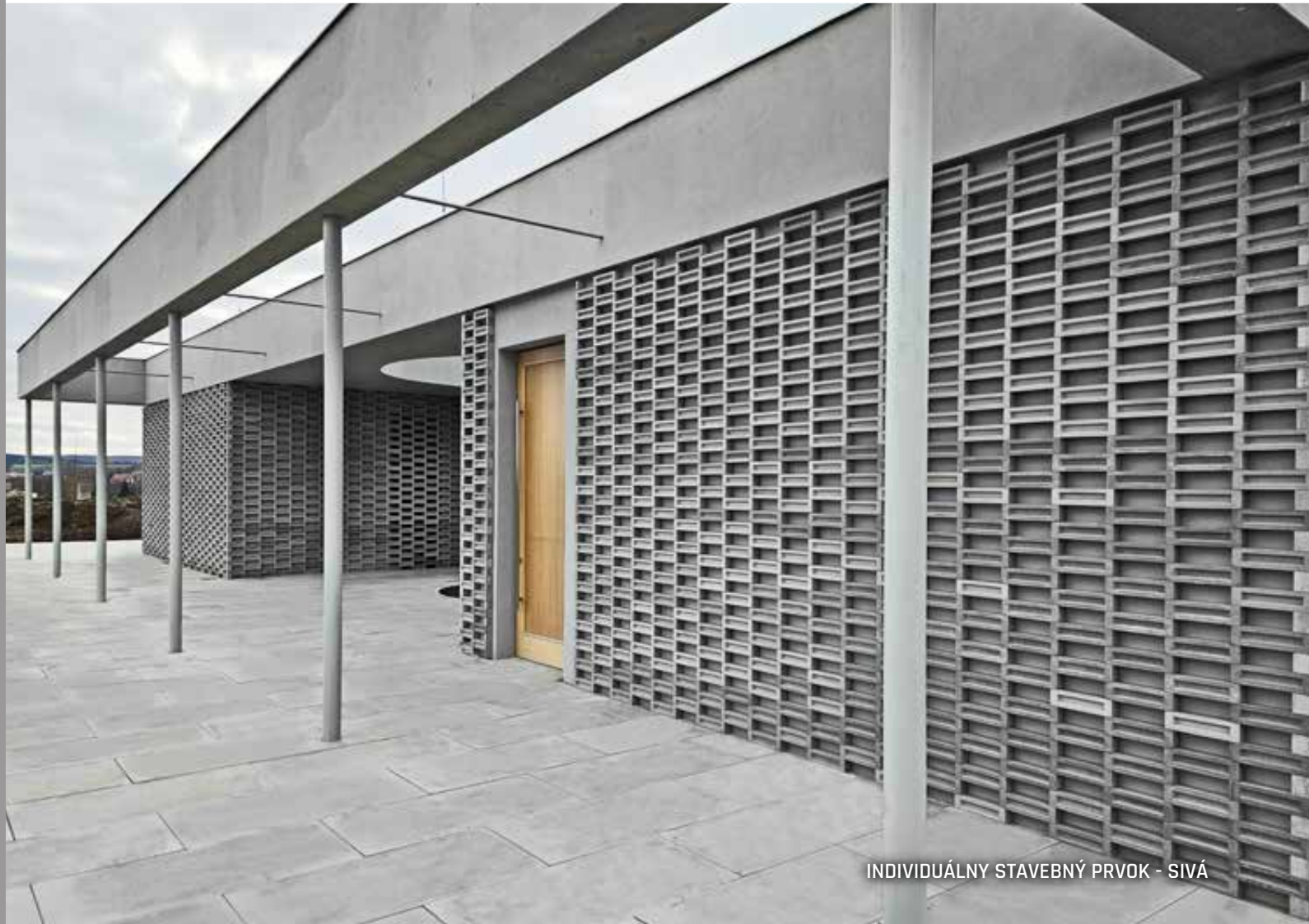
INDIVIDUÁLNY STAVEBNÝ PRVOK - SIVÁ