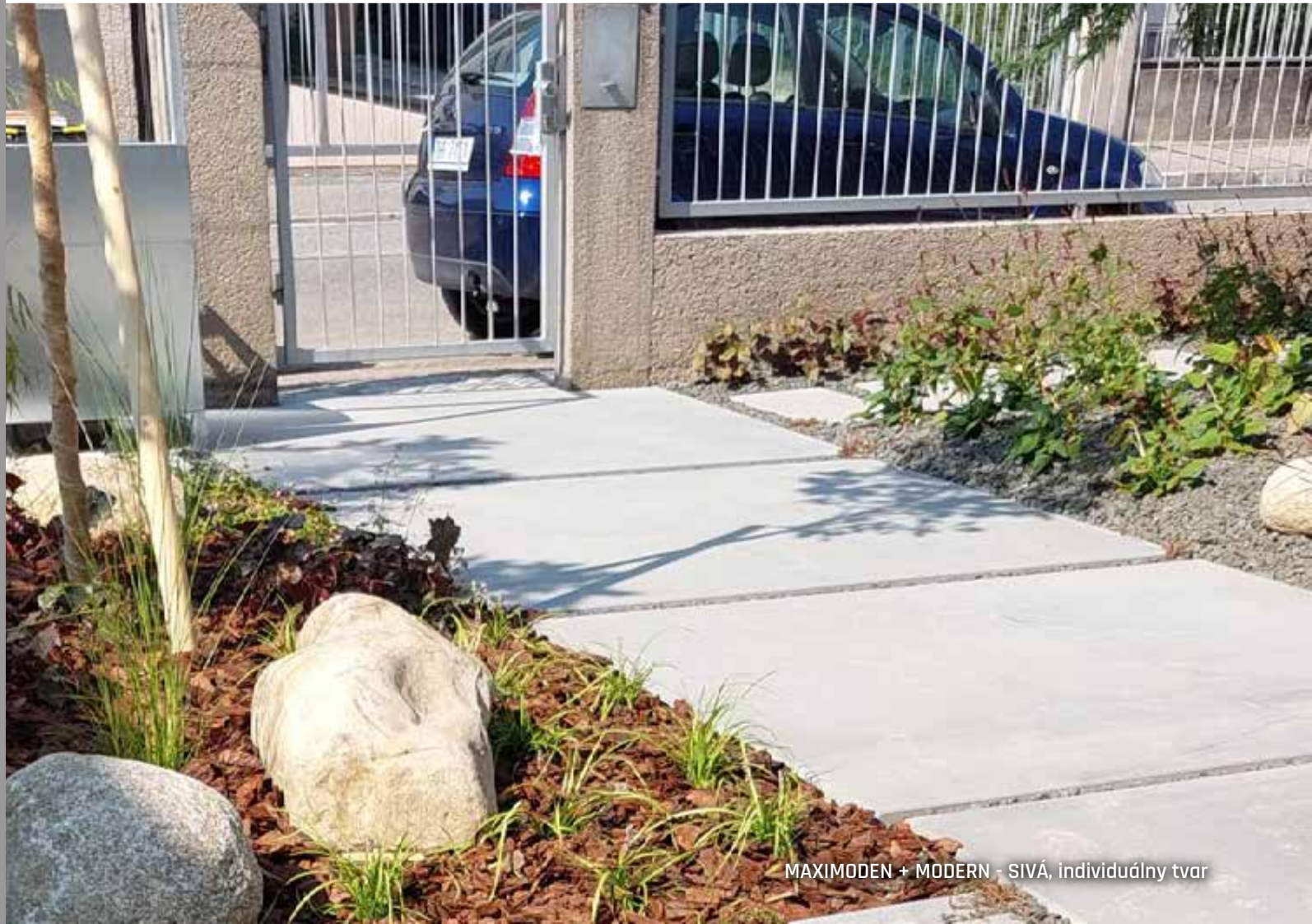
MAXIMODEN + MODERN - SIVÁ, individuálny tvar