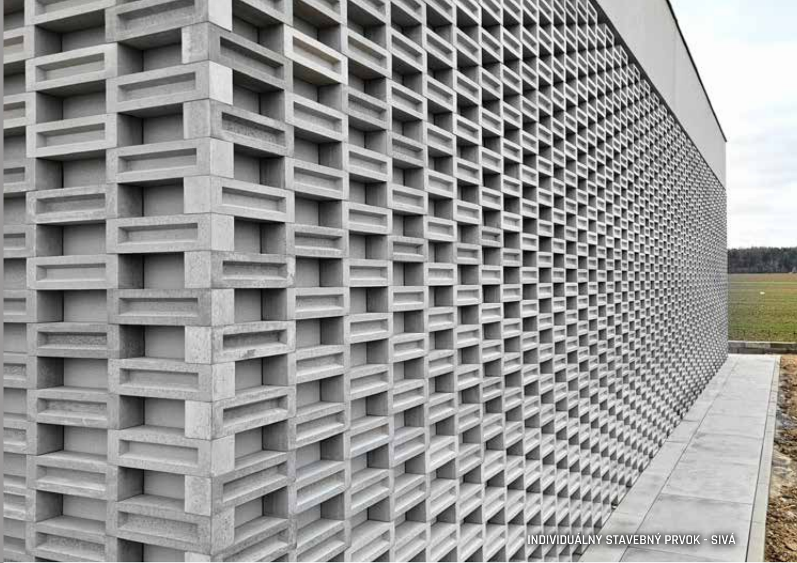
INDIVIDUÁLNY STAVEBNÝ PRVOK - SIVÁ