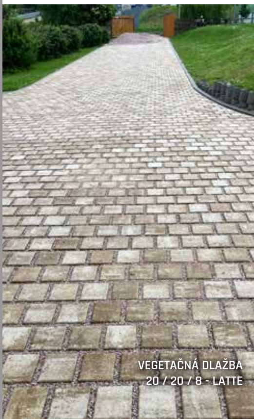
VEGETAČNÁ DLAŽBA 20 / 20 / 8 - LATTE

Napriek tomu, že ponúkame najširší sortiment betónových výrobkov, častokrát sa stretávame aj s požiadavkou na atypické vibrolisované prvky. Jedná sa napríklad o zámery formátov a farieb, pridanie dodatočných povrchových úprav (tryskanie, lakovanie, kefovanie a ďalšie), úpravy a tvorba receptúr, špeciálne dlažobné bloky a ďalšie. Tieto úpravy sú možné na vopred špecifikované množstvá, podľa možností a kapacít výroby.