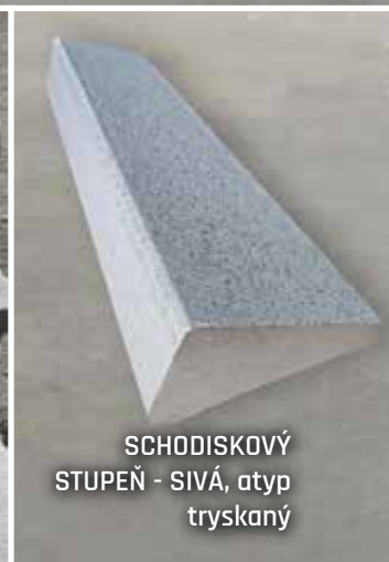
SCHODISKOVÝ STUPEŇ - SIVÁ, atyp tryskaný

» V prípade Vášho záujmu o niečo výnimočné, neváhajte kontaktovať našich obchodných zástupcov. «