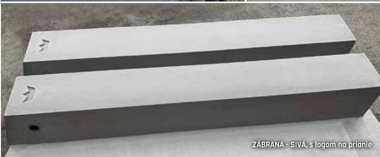
ZÁBRANA - SIVÁ, s logom na prianie