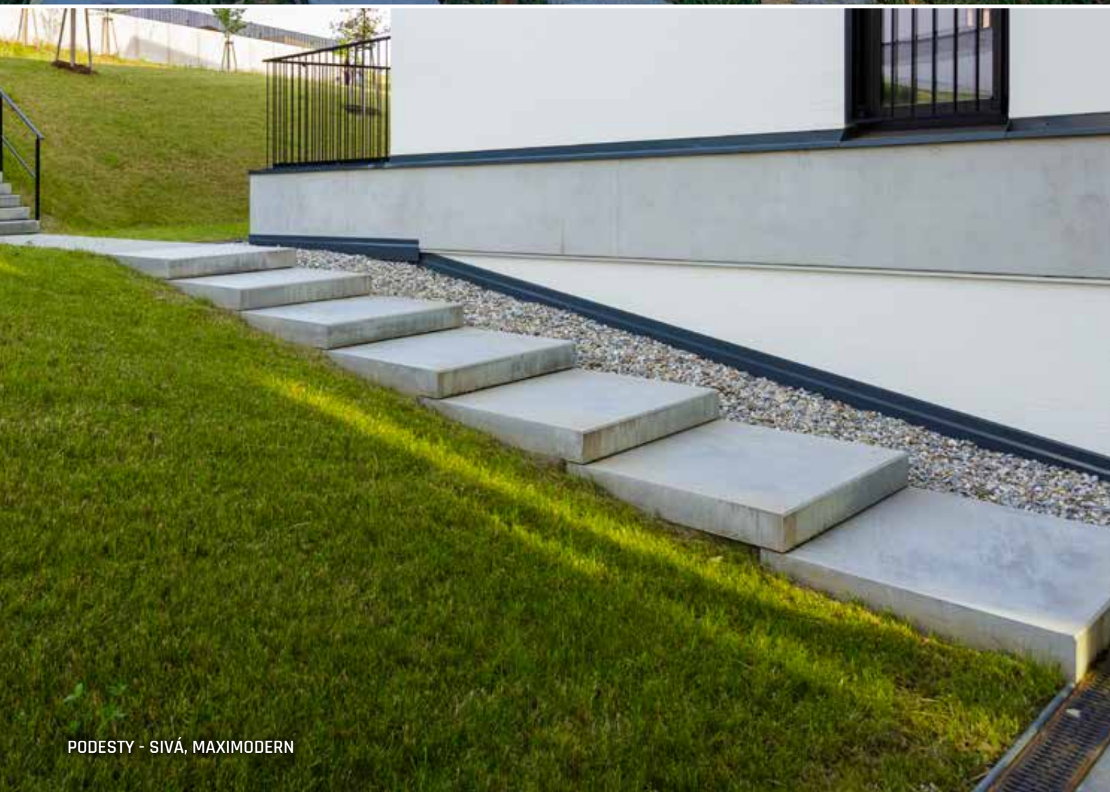
PODESTY - SIVÁ, MAXIMODERN