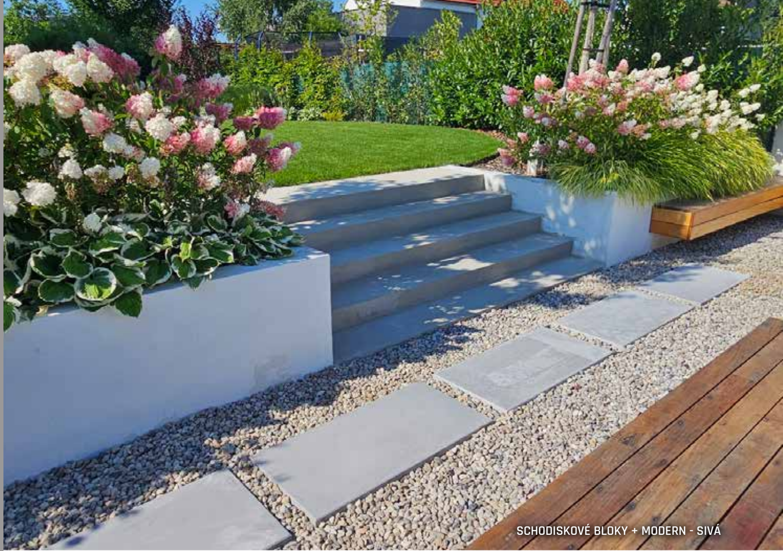
SCHODISKOVÉ BLOKY + MODERN - SIVÁ