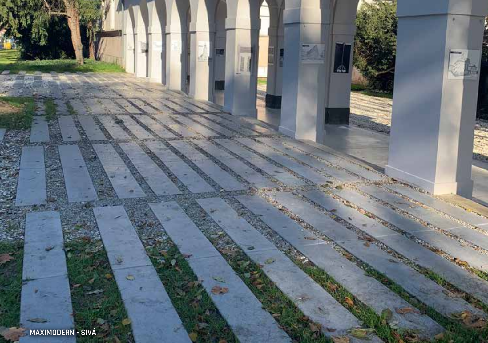
MAXIMODERN - SIVÁ