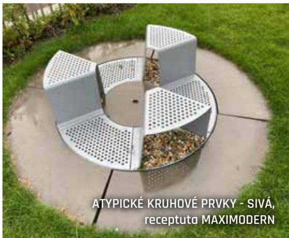
ATYPICKÉ KRUHOVÉ PRVKY - SIVÁ, receptúra MAXIMODERN