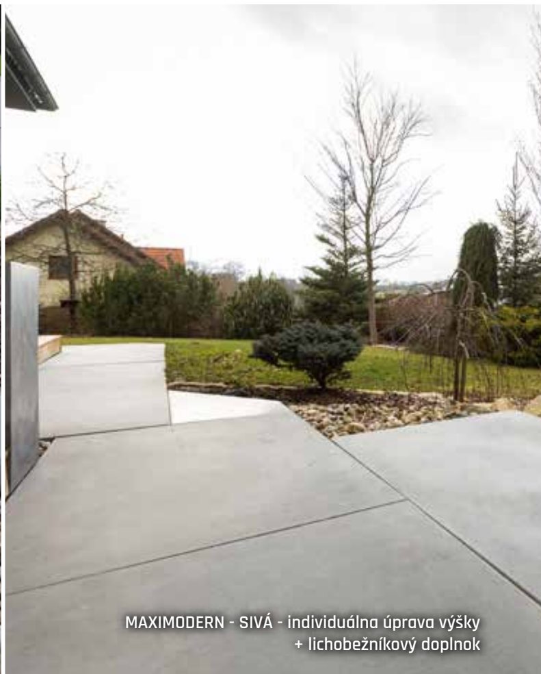
MAXIMODERN - SIVÁ - individuálna úprava výšky + lichobežníkový doplnok